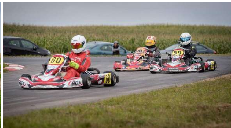
un Latvijas Kartinga atklātā Čempionāta, Pro-Kart kausa 6.posms