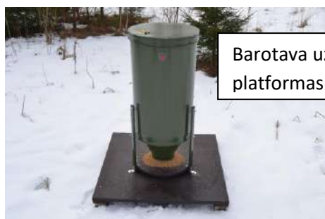
Barotava uz platformas