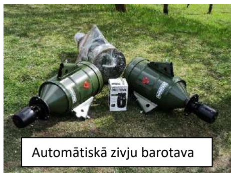
Automātiskā zivju barotava