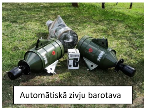
Automātiskā zivju barotava