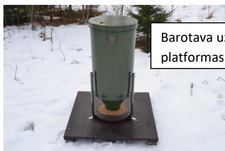
Barotava uz platformas